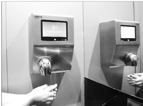
Os baños son unha das zonas máis coidadas e singulares do local.