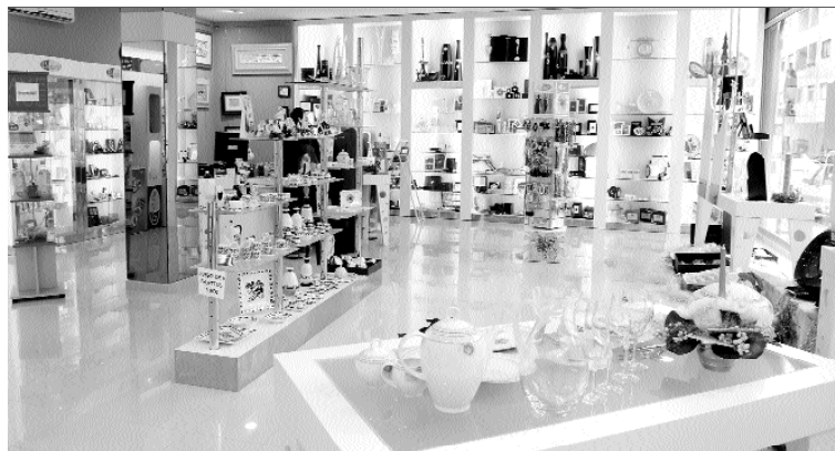
Interior de “Emplata”, un novo establecemento comercial situado na rúa Doutor Pérez Lista do Barco.