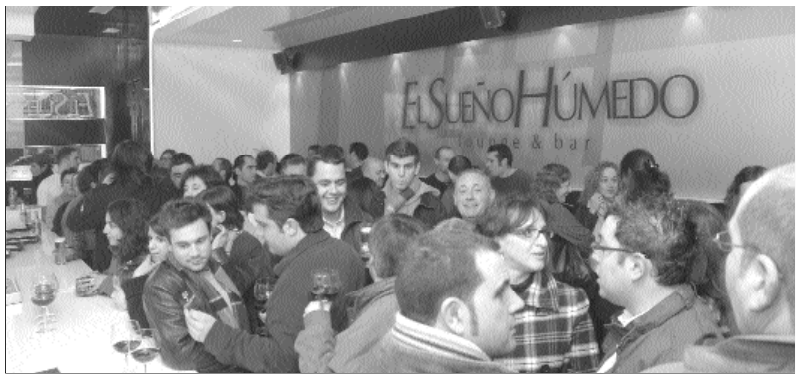
“El Sueño Húmedo” abriu as súas portas a finais de decembro. Está situado na céntrica praza José Otero do Barco.

Para os afeccionados ás infusións este establecemento barquense desprega unha ampla e orixinal gama de opcións nunha carta de ata 29 infusións. Ademais das clásicas, hai tamén té de Ceylán laranxa, escaramu -